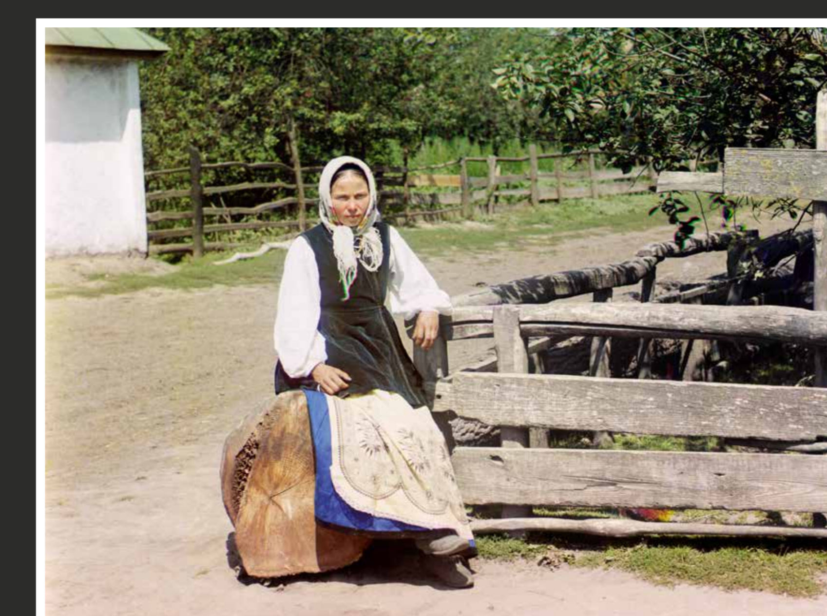
Naine Ukraina külatänaval. Pildistatud 1905–1915.