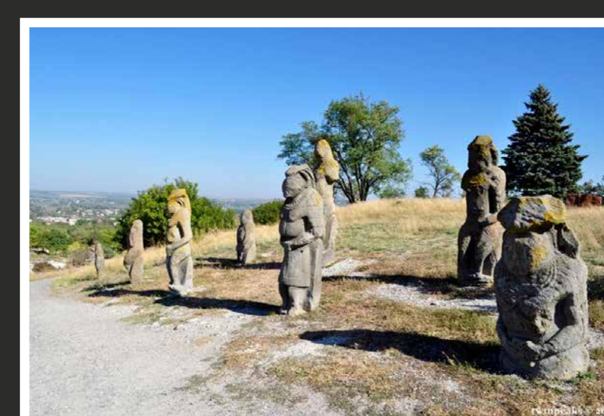
Polovetside rituaalsed kiviskulptuurid 9.–13. saj Ida-Ukrainas Izjumis Kremenetsi mäel.