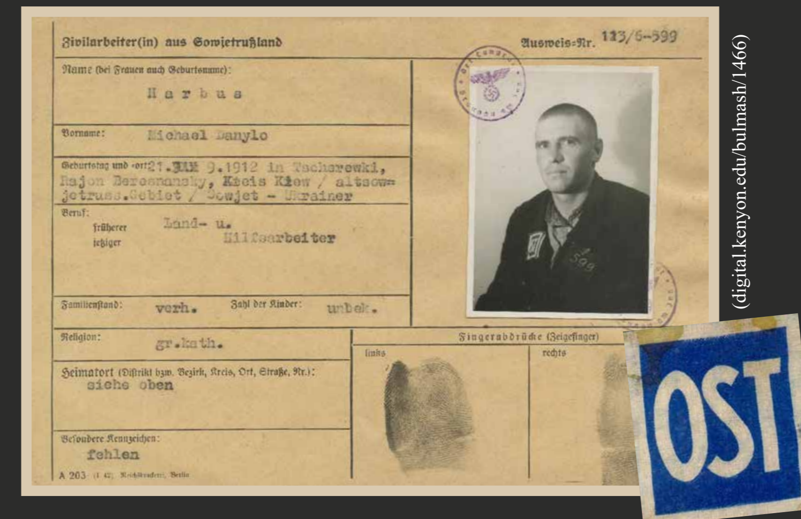
Ostarbeiteri isikutunnistus Ostarbeiteri riietel kantud tunnusembleem

Когда советская власть вернулась в Украину, репрессии продолжались. Все крымские татары, более 200 000 человек, были депортированы в Среднюю Азию, откуда им разрешили вернуться только в конце 1980-х годов. Более 180 000 жителей Западной Украины были репрессированы по подозрению в сотрудничестве с подпольным движением сопротивления. В 1947 году для подавления сопротивления было депортировано еще 76 000 украинцев. СССР удалось подавить вооруженное сопротивление в Украине в середине 1950-х годов.