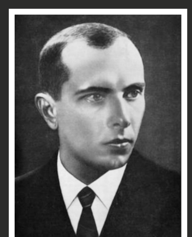
Stepan Bandera (1909–1959)

Борьба Украинской повстанческой армии против двух оккупантов.