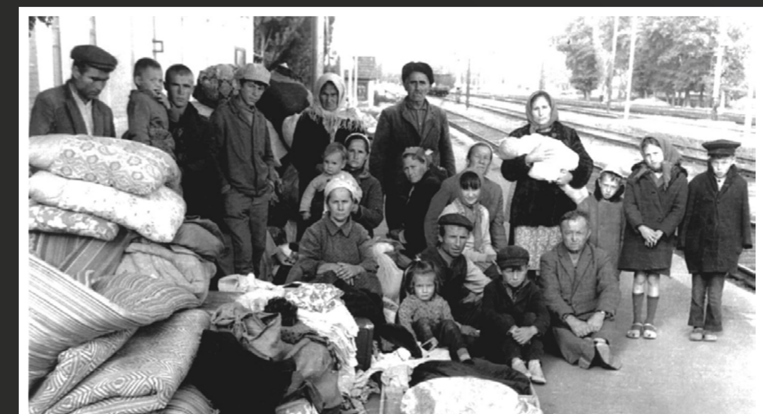
Uuesti Krimmist välja saadatud krimmitatarlaste perekond raudteejaamas 1960. aastatel. Krimmitatarlastel ei olnud lubatud koju tagasi minna. Omal algatusel tagasispõrdujad saadeti uuesti välja.

Семья крымских татар, снова депортированная из Крыма в 1960-х годах. Крымским татарам не разрешалось возвращаться домой. Самовольно вернувшихся людей снова выселяли.