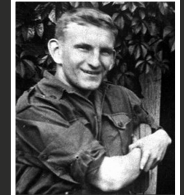
Roman Šuhhevõtš (1907–1950)